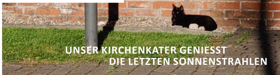
UNSER KIRCHENKATER GENIESST DIE LETZTEN SONNENSTRAHLEN