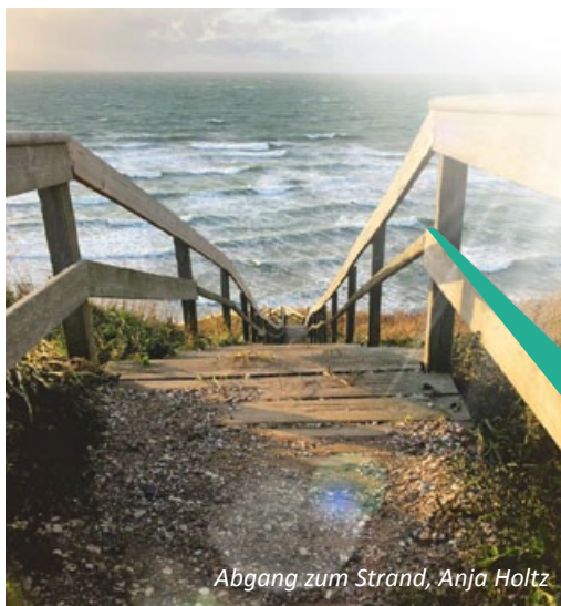
Abgang zum Strand, Anja Holtz