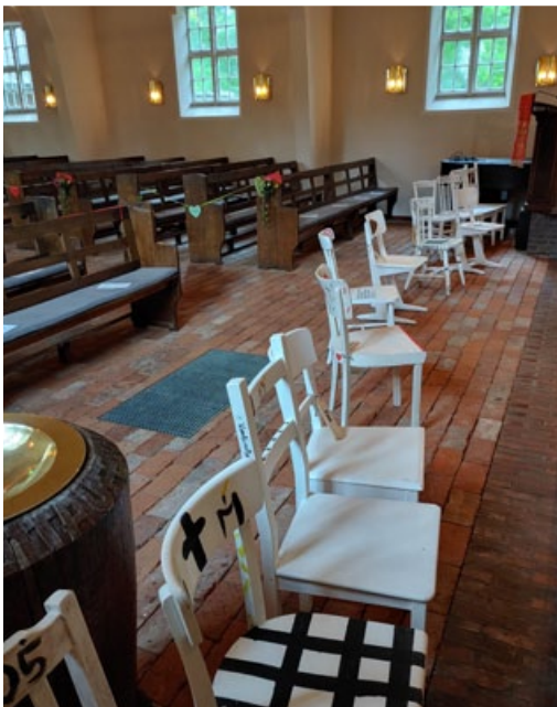
Das Foto stammt vom Konfirmandenabendmahl

Zur Konfirmation gratulieren wir ganz herzlich, wünschen Euch Gottes Segen und freuen uns auf ein baldiges Wiedersehen mit Euch bei uns!