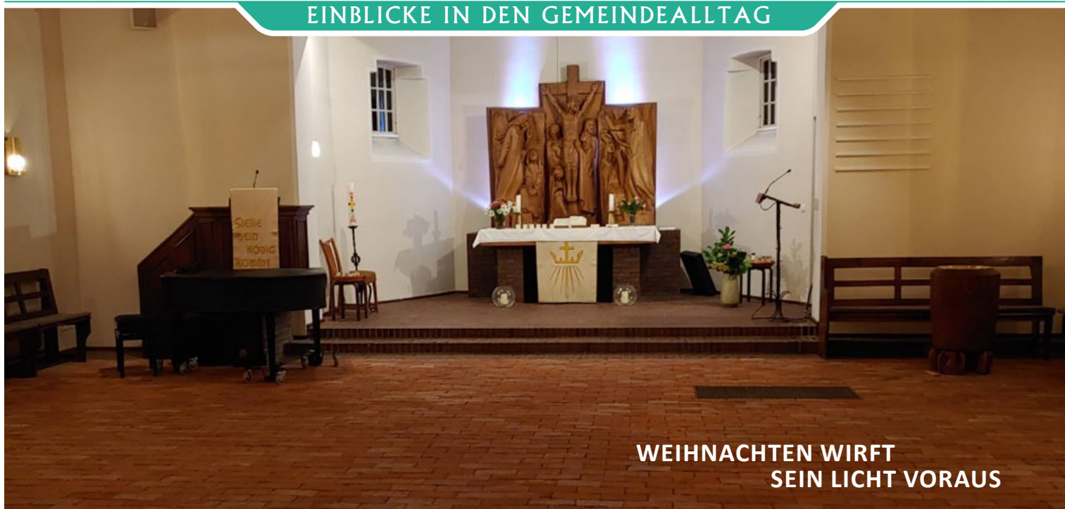
WEIHNACHTEN WIRFT SEIN LICHT VORAUSS