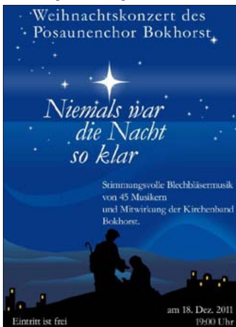
Das Weihnachtskonzert des Posaunenchores, 18.12., 19 Uhr

Ich vertrete mit dieser Meinung nicht die romantische Haltung, dass früher alles besser war. War es gar nicht. Aber Warten auf Weihnachten, sich sehnen nach der ersten Mandarine, sich freuen auf die Lichter, die langsam Richtung Weihnachten