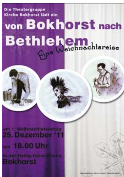
Entwurf und Layout: Marvin Schmidt